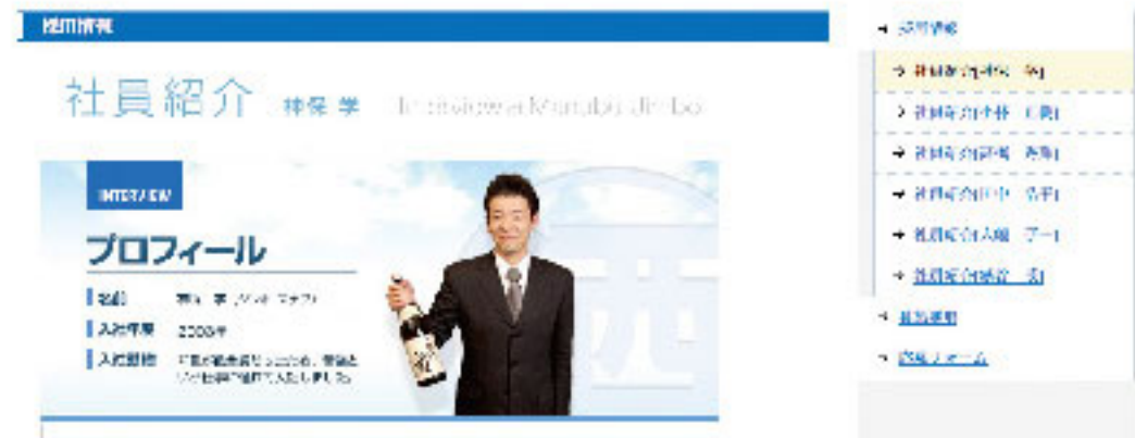
■ WEBサイト (2010)・社員紹介のページ

業務用酒類の卸業務を行うクライアント様より、会社のWEBサイトを一新したいというご要望から、トップページへダイナミックなオリジナルムービーを使用したWEBサイトをご提案いたしました。リニューアル前のサイトデザインと比べて、近年サイズアップの傾向があるパソコンモニターの画面サイズに適応した、各パーツのデザインや、画面構成により、現代的な会社イメージの確立に成功しました。会社の最新情報への配慮として、トップページでは、外部ブログへの導線も考えられています。サイトをリニューアルした後の、更新業務を軽減するご提案を行いました。